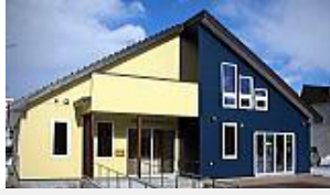
補助拠点 「あくせす根室」