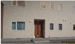
生活サポートセンター

生活サポートセンター「よりそい」では、根室振興局の委託により、別海町・中標津町・標津町・羅臼町にお住まいの方の「日常生活、就労、悩みなどの困りごと」に関する相談を受け、一緒に考え、解決へ向けサポートする相談支援事業を、平成26年度より新たに実施しています。