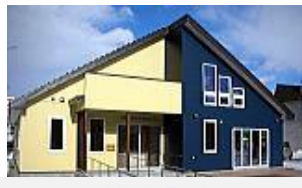
補助拠点 「あくせす根室」