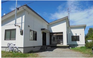
生活サポートセンター

生活サポートセンター「よりそい」では、根室振興局の委託により、別海町・中標津町・標津町・羅臼町にお住まいの方の「日常生活、就労、悩みなどの困りごと」に関する相談を受け、一緒に考え、解決へ向けサポートする相談支援事業を、平成26年度より実施しています。